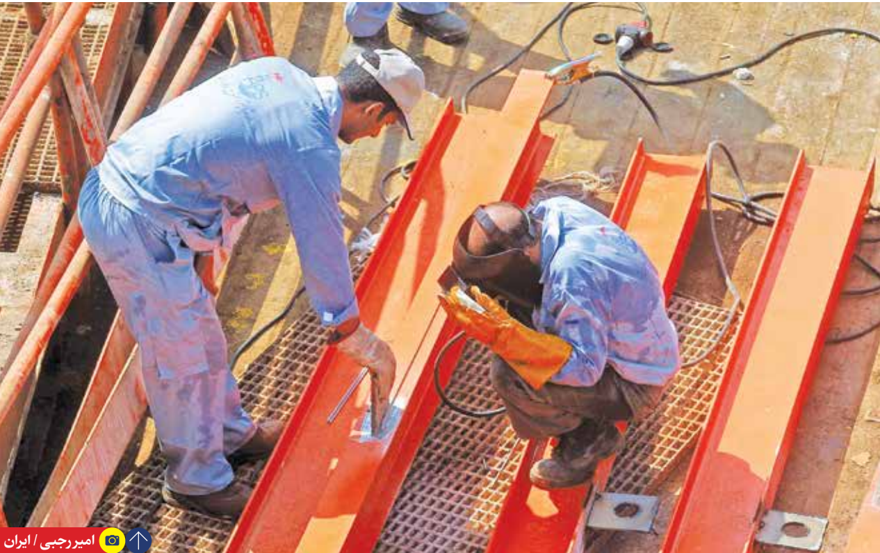
امیررجبی / ایران

رعیتی فرد گفت: پس از برگزاری جلسات مفصل و بررسی مزایا و معایب قراردادهای کار دائم و موقت و اثرات هر یک بر طرفین رابطه کار، اجتماع ارتقای امنیت شغلی کارگران را از مهم‌ترین دغدغه‌های دولت سیزدهم دانستند، مطابق با ماده ۲۲ آیین نامه داخلی هیأت دولت برای سیر مراحل قانونی، در تاریخ ۱۴۰۲/۰۱/۲۸ به معاون اول رئیس جمهور ارائه شد.