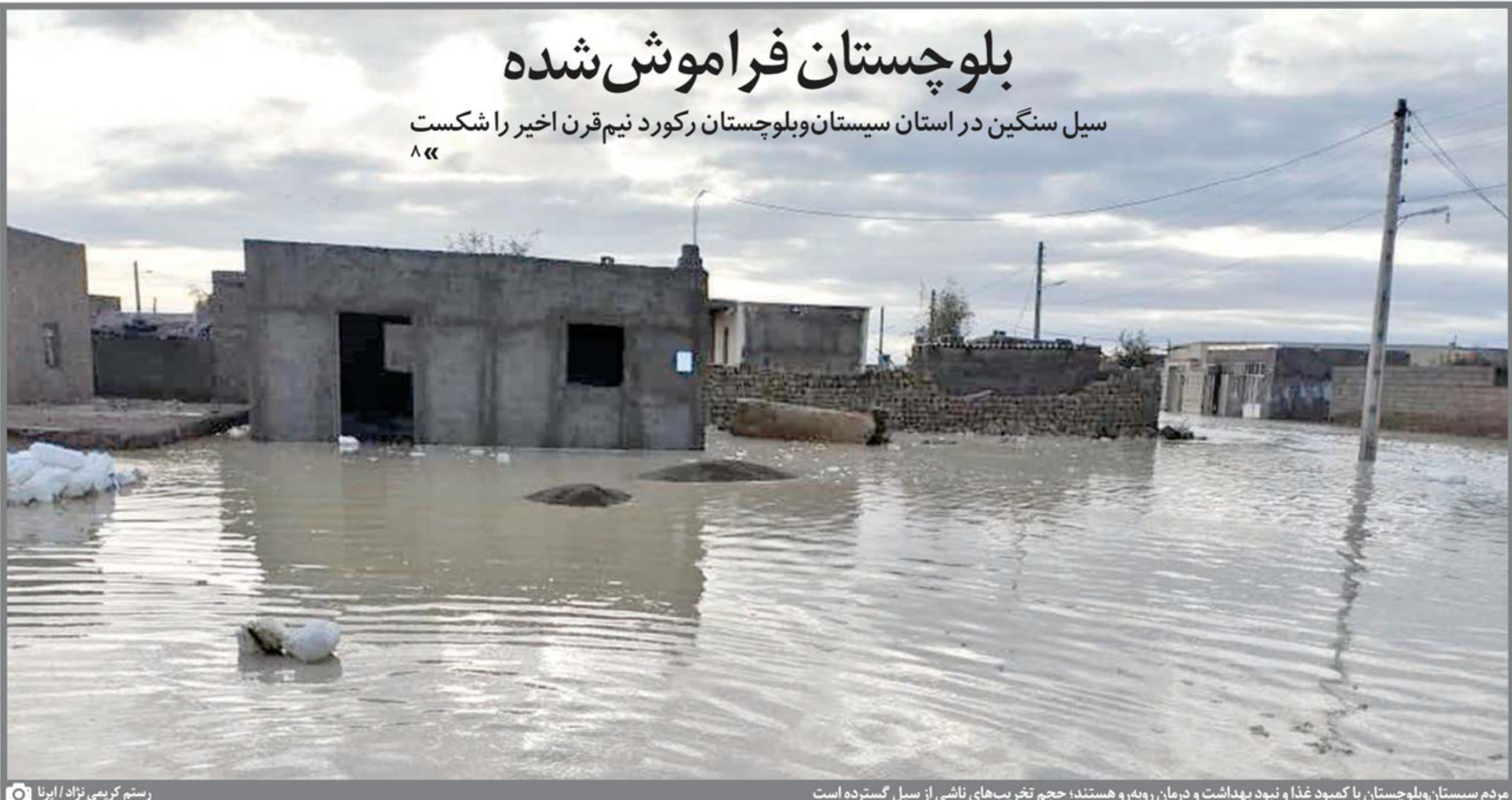
مردم سیستان و بلوچستان با کمبود غذا و نبود بهداشت و درمان روبه‌رو هستند؛ حجم تخریب‌های ناشی از سیل گسترده است

سیل سنگین در استان سیستان و بلوچستان رکورد نیم‌قرن اخیر را شکست